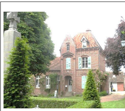
Gerberoy, Sortie / Visite