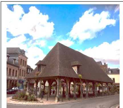
Lyons-la-Forêt, Sortie / Visite