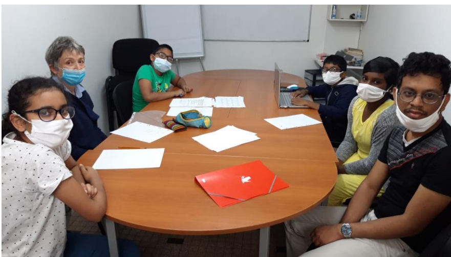
Photo de groupe Journal d'enfant.