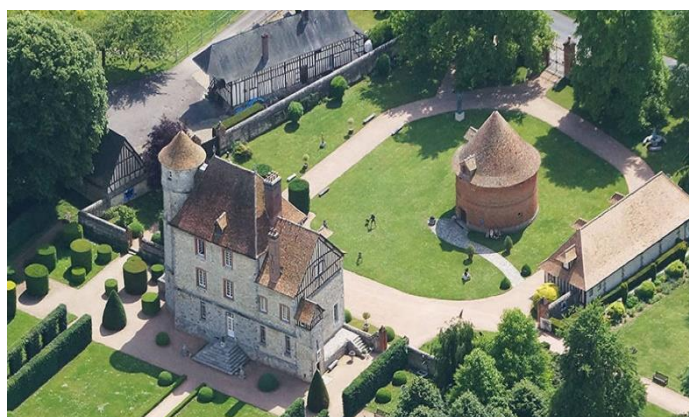
Le château de Vascœuil et son jardin magnifique

Après on est allé voir la rivière qui va du village au château ; on a vu les anciens moulins. On a fait le tour complet du village en le visitant.