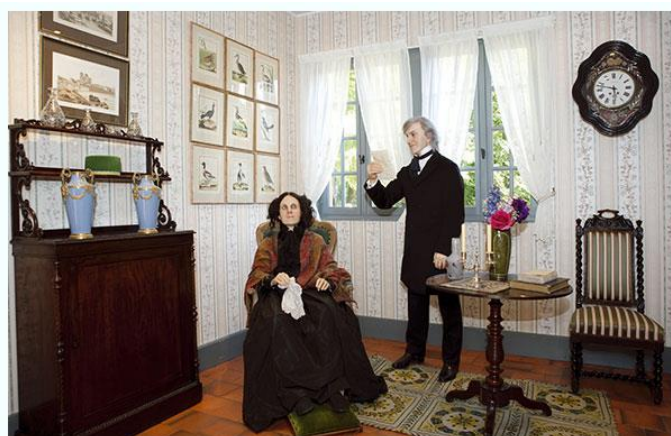
Statue en cire de Jules Michelet et de sa fille dans son musée