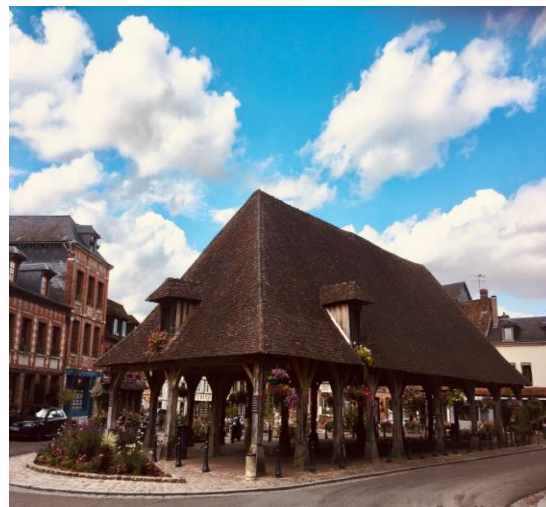
La halle de Lyons-la-Forêt

Dans le grenier de cette Halle, les lyonsais stockaient la nourriture en hauteur pour ne pas que les animaux viennent tout manger. Et la Halle abritait aussi le marché du village juste en dessous.