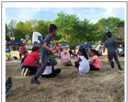
Journée sportive, Sports